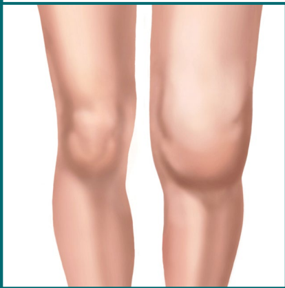
Artritis de rodilla.