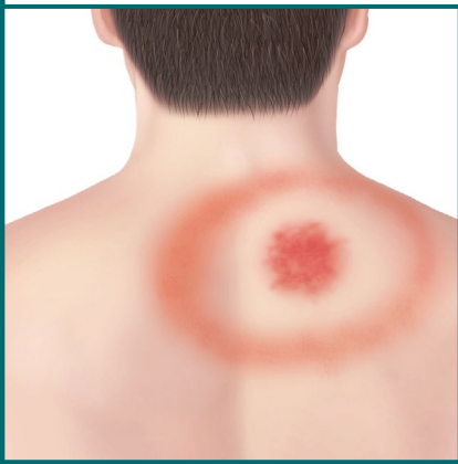
Sarpullido en forma de tiro al blanco en la espalda.